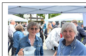
...das Team von der gut besuchten „Futtertheke“