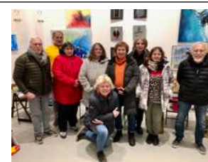
Das Team des KUNST-WÜRFEL e.V. beim Aufbau (Bild li) und das Gruppenbild der ausstellenden Künstler