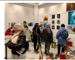
Der Besucherandrang war an beiden Tagen mehr als zufriedenstellend! Innen und Außen war immer „etwas los“