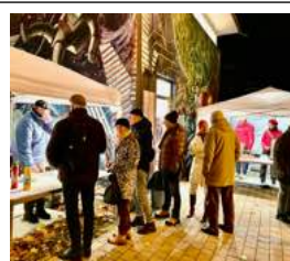
Schöne vorweihnachtliche Atmosphäre (Bild li) und reichlich „Gedrängel“ vor der stark frequentierten Grillstation

Resümee: zufriedene Besucher, Aussteller und Veranstalter freuen sich bereits heute auf unseren ART-VENT in 2025 !!