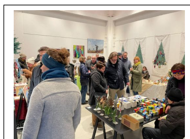
Der Besucherandrang war an den zwei Ausstellungstagen sehr hoch