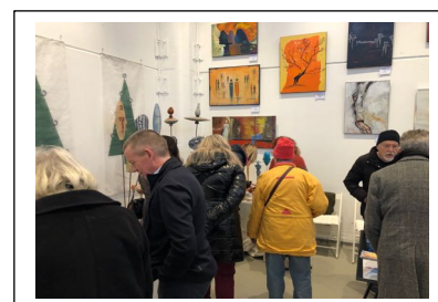
Der Landrat und der Bischofsharler Bürgermeister waren „neugierig“

Die Aussteller des 2. ART-VENT im KUNST-Würfel waren