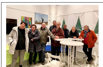
Platt, aber zufrieden ! Mitglieder des KuWü-Teams nach dem Aufbau